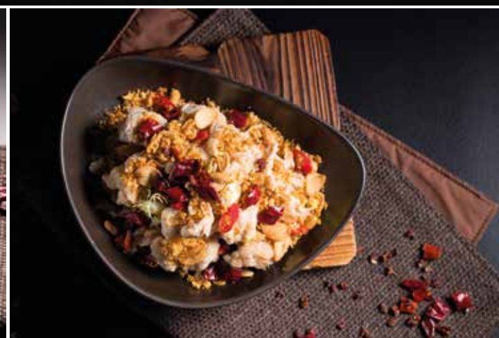
重慶辣子雞 Fried Diced Chicken with Chili in Chongqing Style