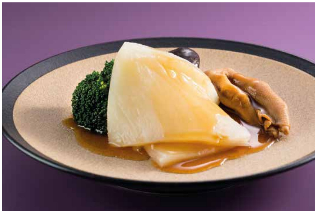
紅燒鵝掌10頭厚花膠 Braised Fish Maw and Goose Web