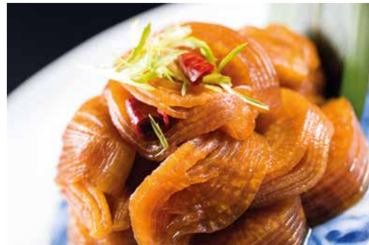
招牌陳醋醃蘿蔔 Marinated Radish