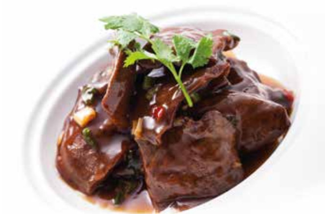
香煎豬肝 Pan fried Pork Liver