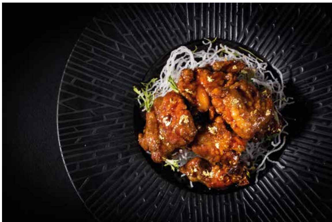
金箔陳醋排骨 Deep Fried Marinated Pork Ribs