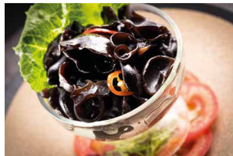
養生涼拌雲耳 Marinated Wood Ear