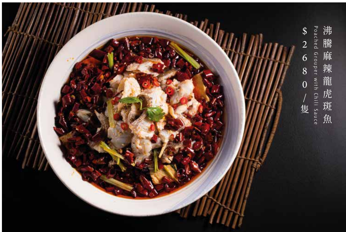
沸騰麻辣龍虎斑魚 Poached Grouper with Chili Sauce $ 2680 / 隻