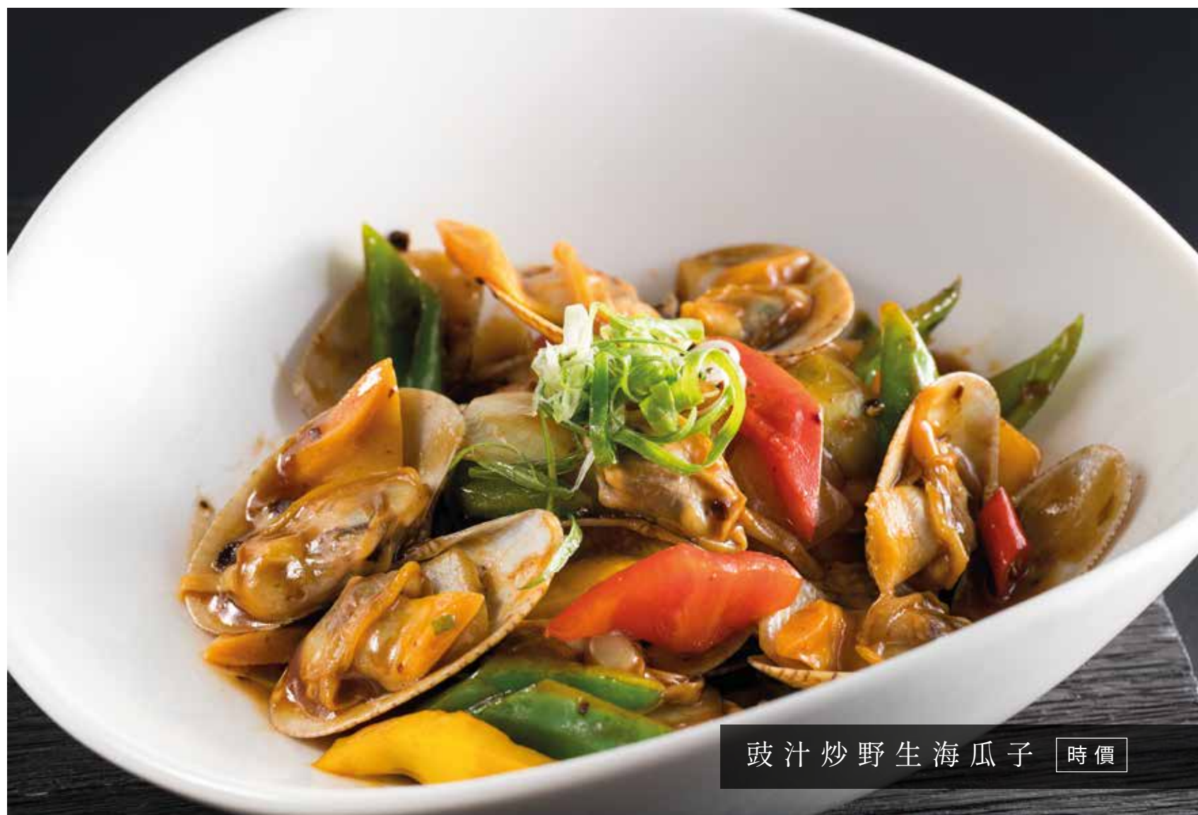
豉汁炒野生海瓜子 時價

以上價格需加收10%服務費, 圖片僅供參考, 出品以實物為準 above price subject to 10% service charge, all pictures are only for reference.