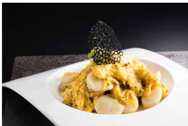
黑松露滑蛋鮮干貝

Stir Fried Scallop with Truffle and Scramble Egg