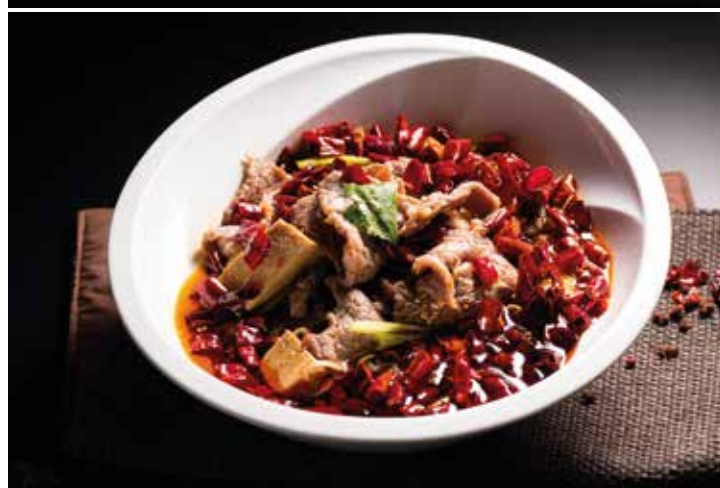
香辣水煮肥牛肉 美國牛 Poached Sliced Beef with Chili Sauce