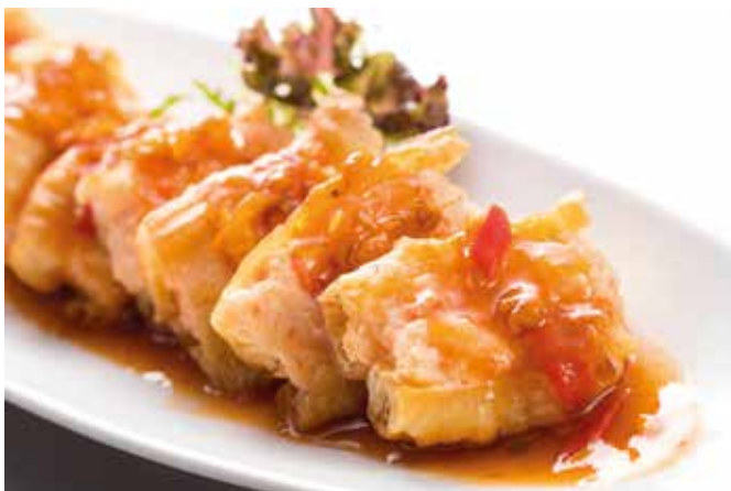
XO 醬百花油條 Fried Breadstick with XO Chili Sauce