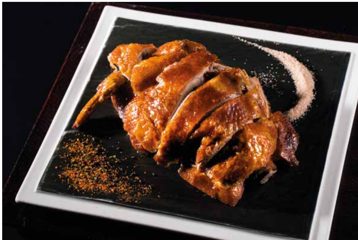
与玥樓炸子雞 Crispy Chicken with Garlic