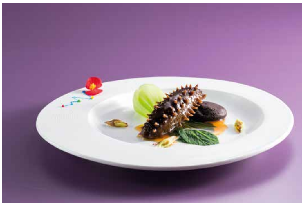
招牌蔥燒刺參 Braised Sea Cucumber with Scallion