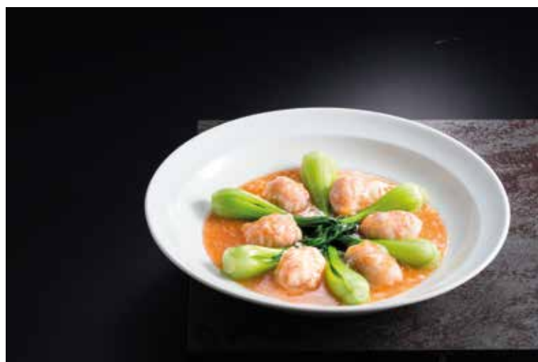
紅梅百花釀鮮干貝