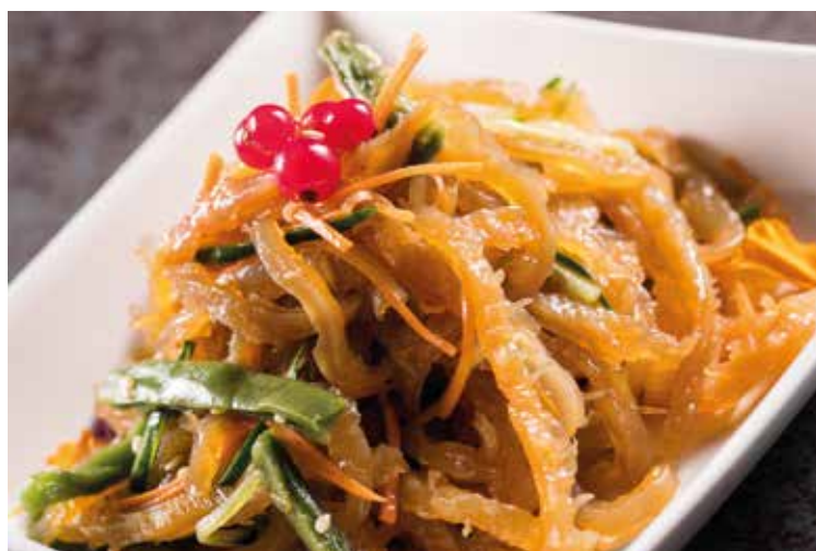
貢菜海蜇 Marinated Jellyfish