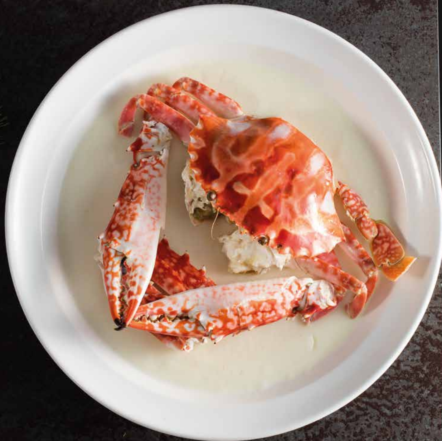
蛋白花雕酒蒸花蟹