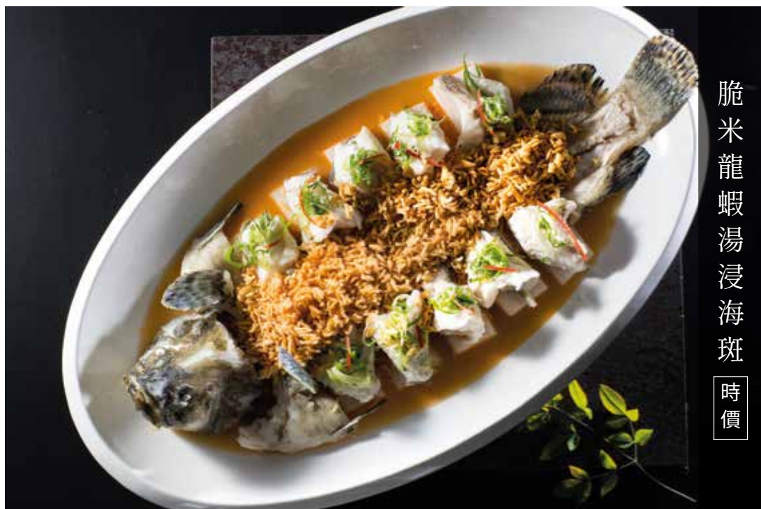
脆米龍蝦湯浸海斑