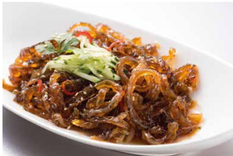
芝麻醋香魚皮絲 Marinated Shredded Fish Skin