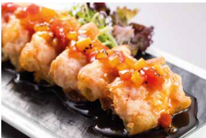
鮮果百花油條 Fried Breadstick with Diced Fruits